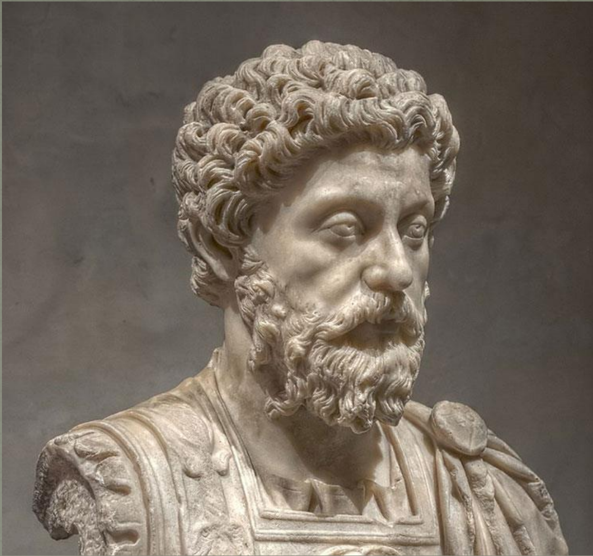
Марк Аврелій / Marcus Aurelius Antoninus Augustus (римський імператор у 161-180 рр.)