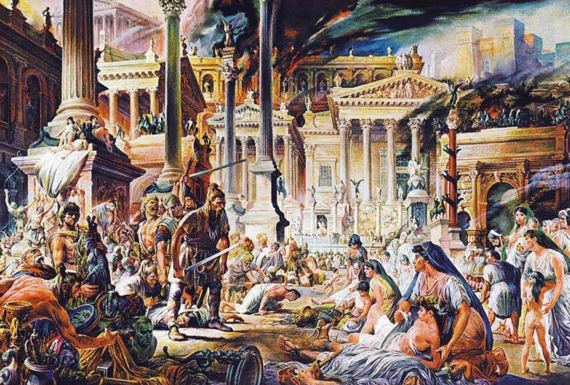
Взяття Риму готами (410 р.)