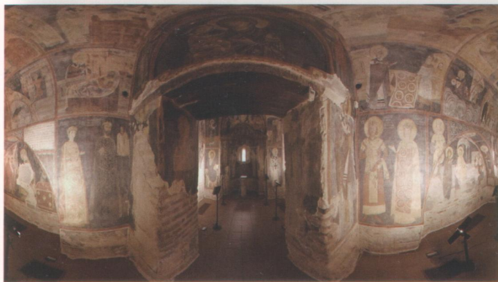
БОЯНСКАТА ЦЪРКВА „СВ. СВ. НИКОЛА И ПАНТЕЛЕЙМОН“

В подножието на планината Витоша, сгушена сред великолепен парк, се намира малката Боянска църква. Нейните стенописни шедеври от 1259 г. са смятани за предвестник на Европейския ренесанс и заслужено й отреждат място в Списъка на световното културно наследство на Юнеско още през 1979 г.