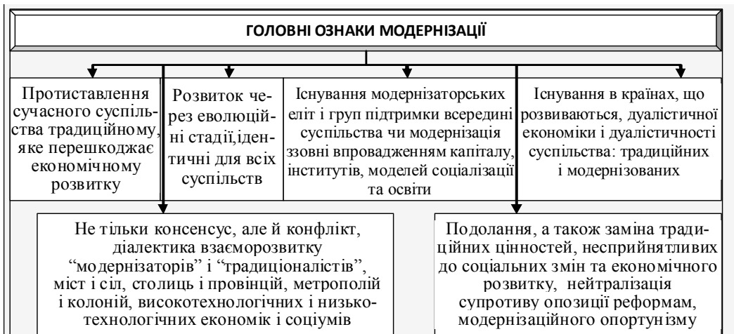
Рис. 3. Головні ознаки модернізації в сучасній структурно-функціоналістичній теорії

Слід відзначити, що нечіткість вихідних понять, еволюція історичного процесу викликали необхідність численних доповнень вихідної концепції модернізації. Сучасний модифікований модернізаційний підхід помітно дистанціювався від класичної версії, перетворившись з односторонньої, абстрактної концепції в історико-емпіричних дослідженнях на суперечливу, заплутану й еластичну по відношенню до історичної реальності дослідну програму. Але прихильники теорії модернізації підкреслюють, що модернізаційна перспектива ніколи не претендувала на роль універсальної пізнавальної відмічки, що пояснює все і вся в історичному минулому [5, с. 104]. Відповідно, у сучасній структурно-функціоналістичній теорії виділяють дещо інші головні ознаки модернізації, що їх запропоновано на рис. 3.