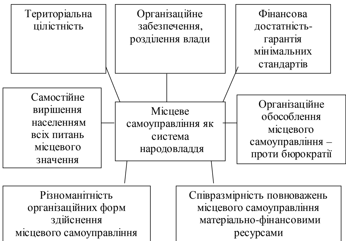
Рис 8.1. - Системна модель місцевого самоврядування

Право і здатність місцевих органів влади регулювати й управляти частиною суспільних справ в інтересах населення в рамках закону і під свою відповідальність, територіальна цілісність, різноманіття організаційних форм здійснення місцевого самоврядування, матеріально-фінансова достатність у частині гарантованості мінімальних соціальних стандартів, домірність повноважень місцевого самоврядування ресурсами - все це становить сукупність взаємозалежних і взаємообумовлених принципів, що складають своєрідну системну модель (рис.8.1).