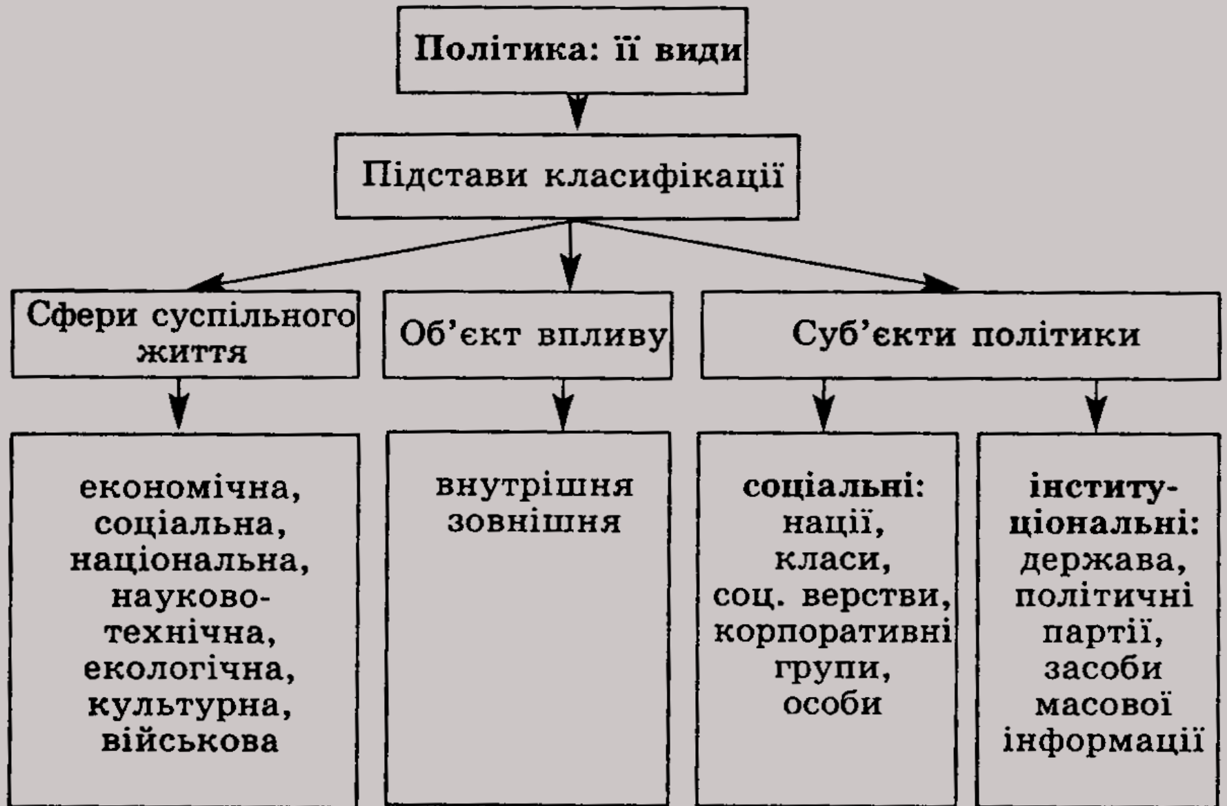
Схема 1. Типологія видів політики