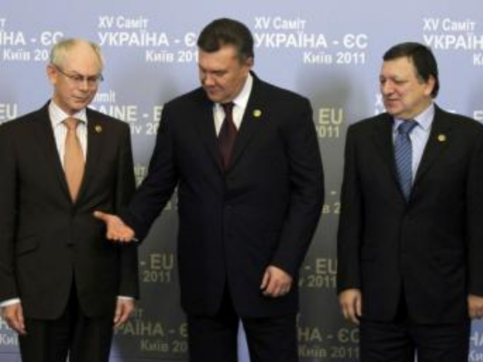
Глава Євросоюзу Х. ван Ромпій, президент України В.Янукович і голова Єврокомісії Баррозу на саміті в Києві 19.12.2011 р.