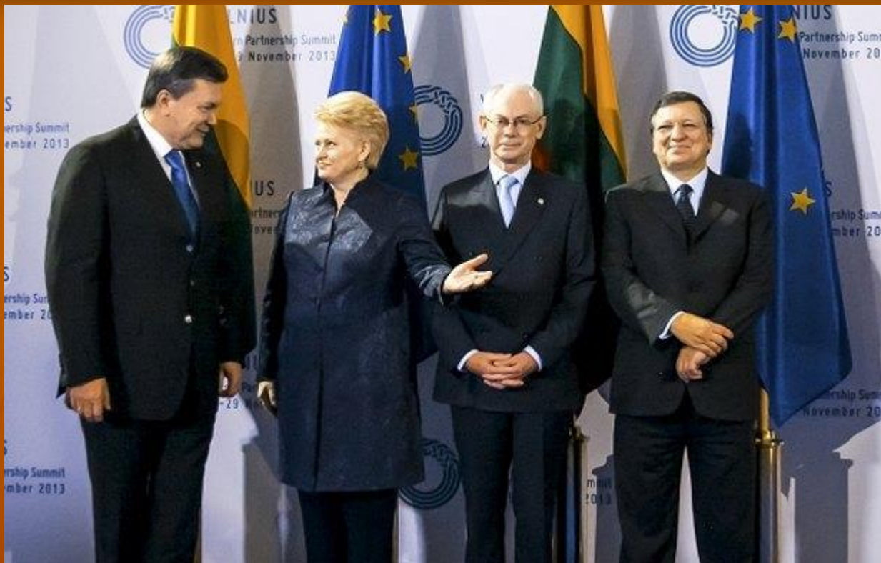
Вільнюс-2013, саміт «Східного партнерства», 29.11.2013