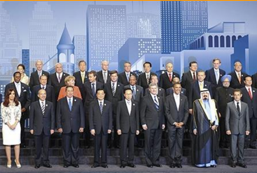
Саміт G20, або "Великої двадцятки" - об'єднання найпотужніших економік світу 3.11.2011