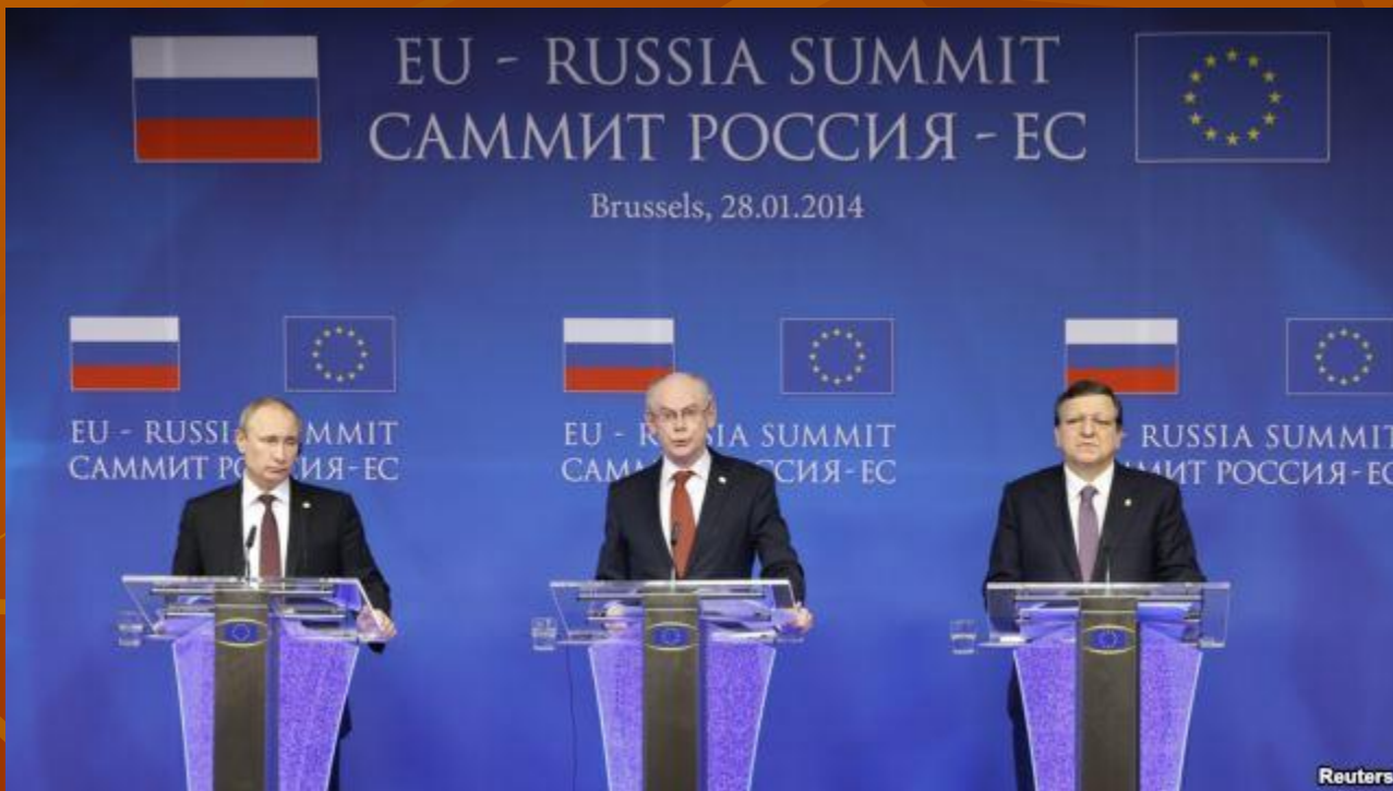
Саміт ЄС – Росія 28 січня 2014 року