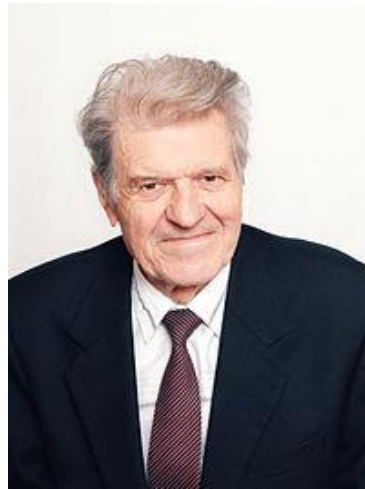
Євген Товстуха — український науковець, лікар-фітотерапевт, письменник.