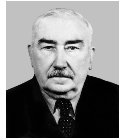
Василь Кархут – український лікар, фітотерапевт, письменник. Особистий лікар митрополита УГКЦ Андрея Шептицького, наш земляк.