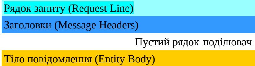
Рис.1. Загальна структура запиту HTTP

HTTP-запит складається із заголовку запиту та його тіла, які розділяються пустим рядком (Рис.1). Тіло запиту може бути відсутнім.