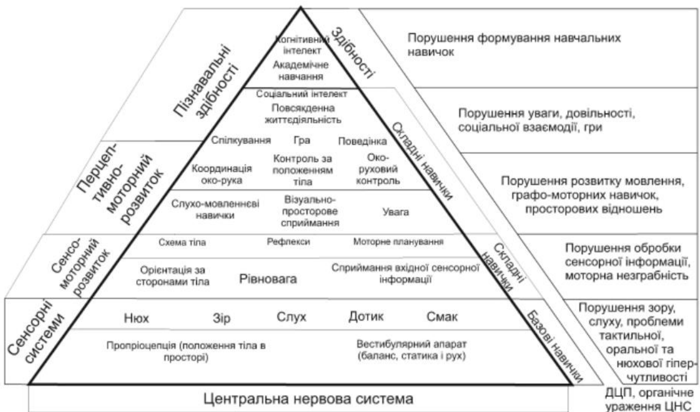
Рис. 2.1. Проекція порушень розвитку дітей на піраміду навчання