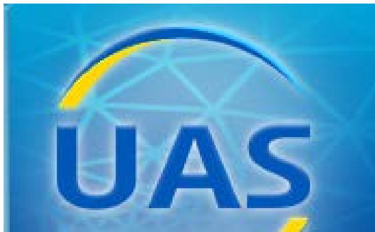
Рисунок 3.2 – Українське Агентство зі Стандартизації, логотип

Наразі підприємство проходить процес ребрендингу, тобто зміни назви на ДП «Українське агентство зі стандартизації» (UAS). Нова назва НОС — Українське Агентство зі Стандартизації (рис. 3.2). Отже, НОС, ДП «УкрНДНЦ» та УАС (UAS) – це одне й те саме підприємство.