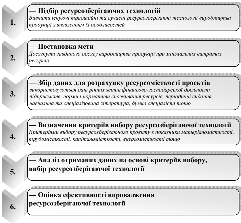
Рис. 1.3. Алгоритм вибору ресурсозберігаючої технології

На думку С. Дятлова в ХХІ в. виник новий вид конкуренції - інноваційна гіперконкуренція, здійснювана з використанням домінантних інновацій та вертикально-мережевої інтеграції, що включає нові методи керованого впливу на цілі, мотиви, інтереси, потреби і економічну поведінку людей: партнерів, потенційних конкурентів, споживачів, - з метою отримання запланованих вигод і ефектів [24, с. 69-76].