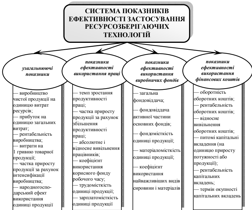
Рис. 1.5. Система показників ефективності застосування ресурсозберігаючих технологій

З урахуванням вказаних принципів визначена наступна система показників ефективності застосування ресурсозберігаючих технологій (рис. 1.5).