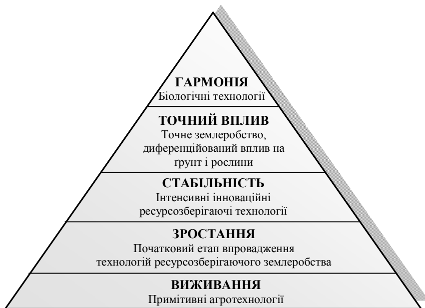
Рис. 1.1. Піраміда етапів розвитку технологічного рівня виробництва в землеробстві

В нинішніх умовах господарювання стала звичайною практика, коли прихід інвестора ставить перед виробником цілі і завдання відповідно до змін, які відбудуться в технічному оснащенні за рахунок вкладеного капіталу. Таким чином, цілі і завдання виробничої діяльності сільськогосподарського підприємства змінюються залежно від наявної матеріально-технічної бази та фінансових ресурсів. Поліпшення фінансового стану підприємства тягне за собою перегляд цілей і завдань виробництва сільськогосподарської продукції (рис. 1.1).