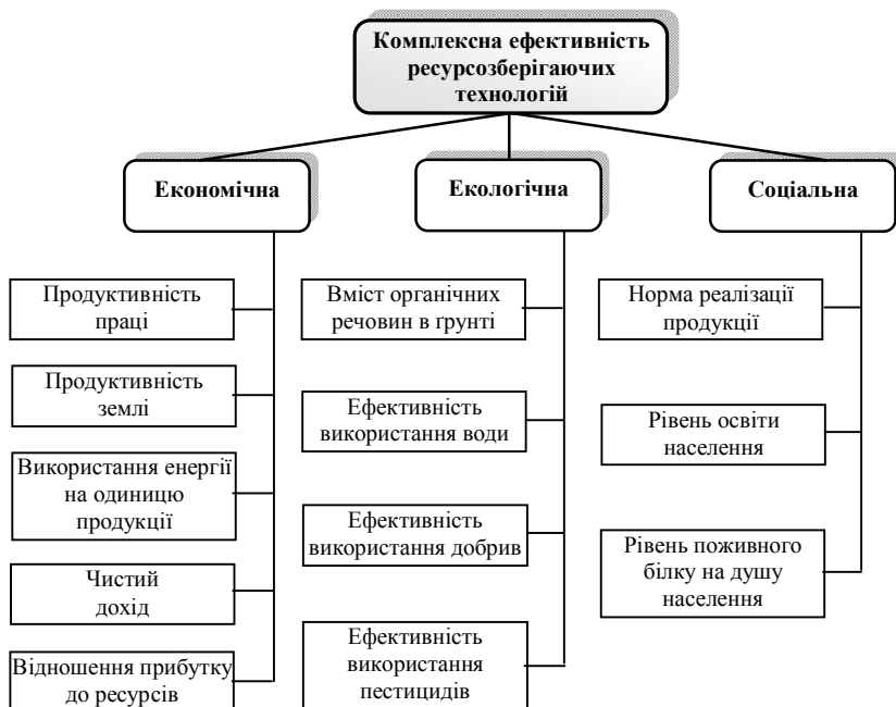
Рис. 1.4. Система оцінки комплексної ефективності ресурсозберігаючих технологій

Економічна ефективність ресурсозберігаючих технологій визначається за їх впливу на поліпшення кінцевих показників сільськогосподарського виробництва, головним чином на приріст прибутку за рахунок підвищення врожайності культур, поліпшення якості продукції, скорочення витрат праці та зниження собівартості виробництва продукції.