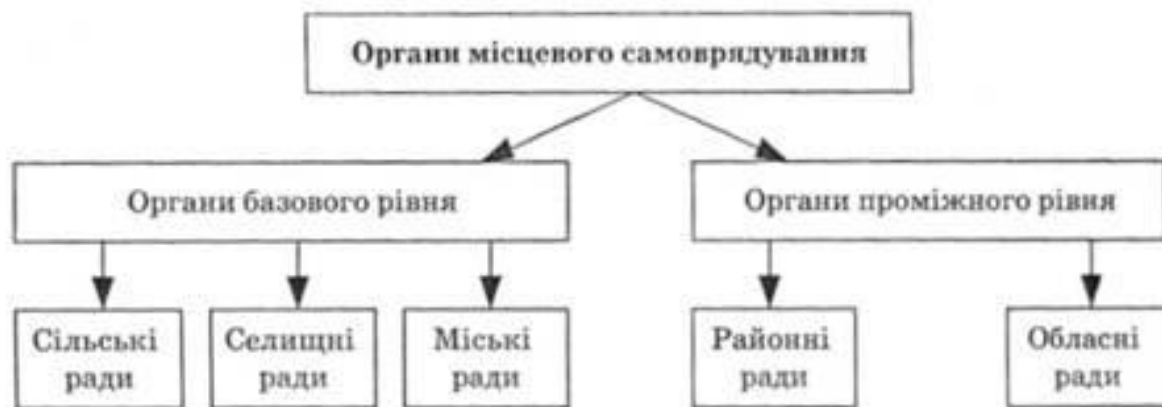
Рис. 12.3. Органи місцевого самоврядування

Органи місцевого самоврядування — це структурно-організовані колективи службовців або одного службовця, що наділяються владою у системі місцевого самоврядування для реалізації владних рішень. Це виборні й інші органи, наділені повноваженнями на вирішення питань місцевого значення і не входять до системи органів державної влади.