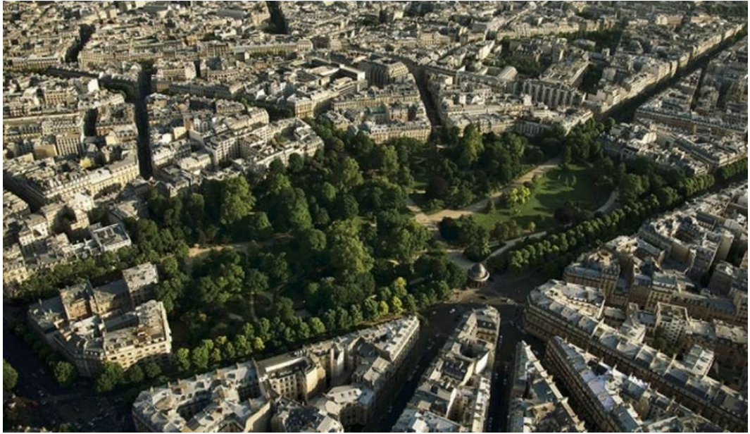
Рисунок - Парк Монсо