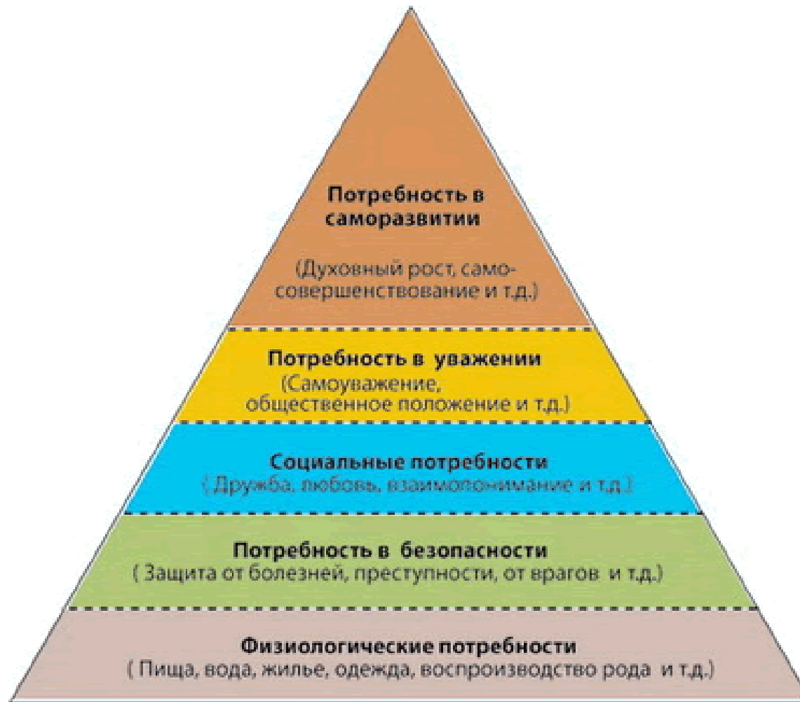
Піраміда потреб А.Маслоу