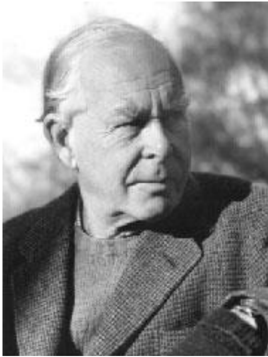
Джон Боулбі (1907-1990)

Прив'язаність – зв'язок між людьми на рівні імпульсів, що зберігається невизначений час навіть, якщо ці люди не живуть разом