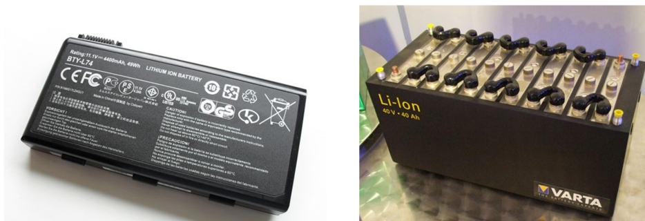
Рисунок 2 – Хімічні джерела струму та акумулятори із сполук літію

Найбільший обсяг споживання рідкісних металів пов'язаний з виробництвом сплавів. Сплави з рідкісних металів широко використовуються в авіа- та ракетобудуванні. Сплав «склерона» Al-Li як конструкційний матеріал використовують в авіації.