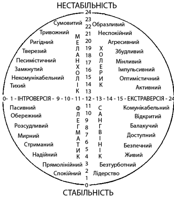
Рис. 9.2. «Коло Айзенка»

властивостей темпераменту за допомогою корекції деяких рис характеру.