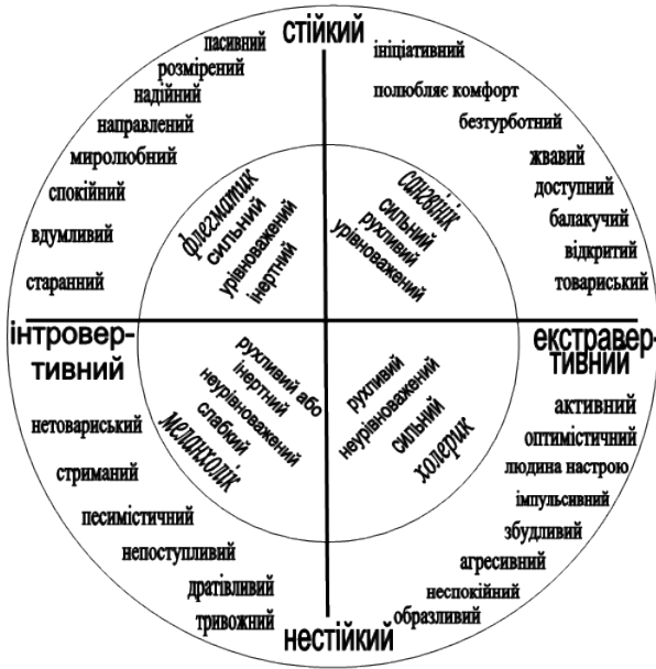
Рис. 9.1. Приклад кола Айзенка

Іншими характерологічними рисами особистості володіють представники холеричного і флегматичного темпераментів. Отже, кожний з чотирьох типів темпераменту (у класичному його варіанті) має визначені ознаки, які у структурованому вигляді описані Г. Айзенком (див. рис. 9.1 ).