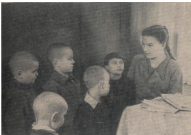
Рис. 1. Бывшая воспитанница стационара, ученица VII класса массовой школы, рассказывает о том, как она научилась правильно говорить.

Наряду с этим была развёрнута работа по анализу звукового состава слова. Вначале сравнивали слова, отличающиеся лишь одним-двумя звуками, и здесь обнаружилась необходимость различать звуки, а для этой цели привлечь не только слуховое восприятие, но и другие рецепторы, а также, как мы увидим ниже, графические образы.