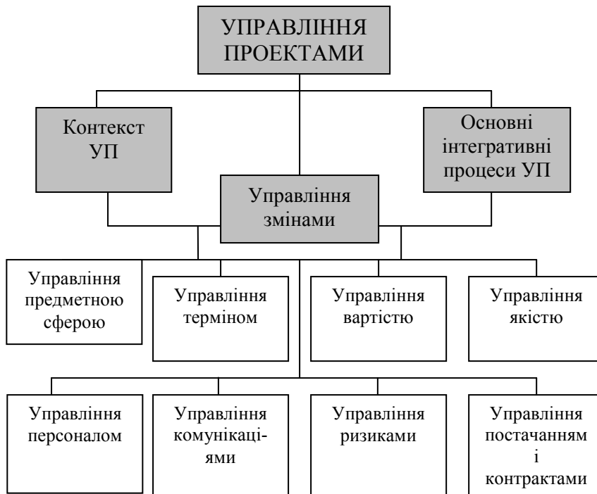
Рис. 1- Сучасна концепція управління проектом

Для успішного здійснення проекту необхідно виділити його повні ознаки, які дадуть змогу менеджерам побачити об'єкти правління та використати необхідний інструментарій для його реалізації.