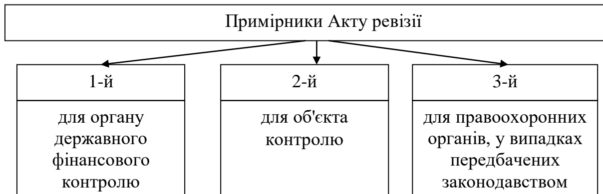
Рисунок 3.3 Кількість примірників Акту ревізії

Кількість примірників Акту ревізії наведена на рисунку 3.3.