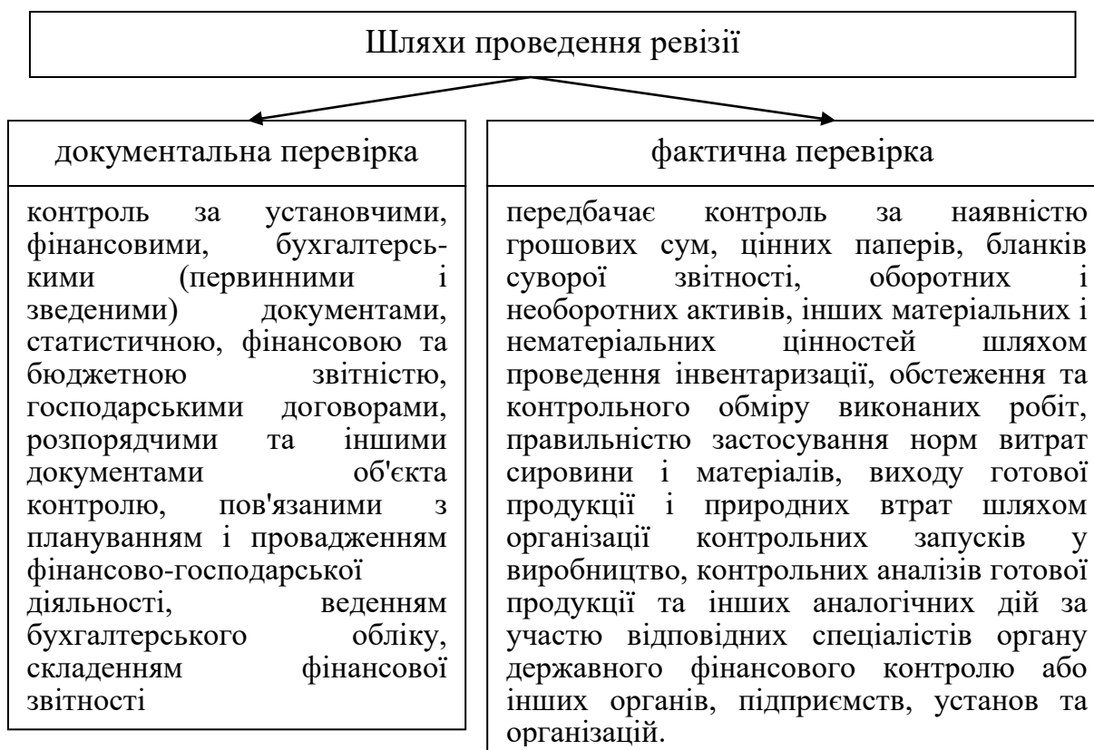
Рисунок 3.1 - Шляхи проведення ревізії Державною Аудиторською Службою України

У разі ведення бухгалтерського обліку з використанням електронних засобів зберігання і обробки інформації на вимогу посадової особи органу державного фінансового контролю керівник об'єкта контролю повинен забезпечити оформлення відповідних документів на паперовому носії. Надання документів об'єкта контролю посадовим особам органу державного фінансового контролю забезпечується керівником об'єкта чи його заступником.