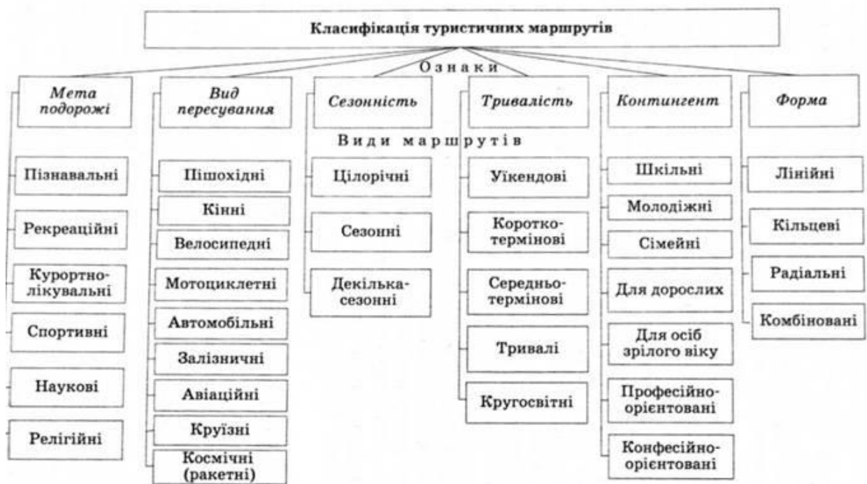
Рис. 3. Класифікація туристичних маршрутів

В основі класифікації туристичних маршрутів лежать класифікація турів. Відмінність полягає у меншій кількості ознак - їх шість (див. рис. 3).