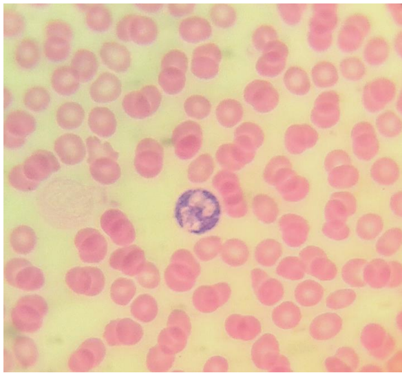
Рисунок Б.1 – Нейтрофіл з високим рівнем КБ

Гранули катіонних білків в цитоплазмі нейтрофільного гранулоциту крові у жінок, хворих на гострий панкреатит