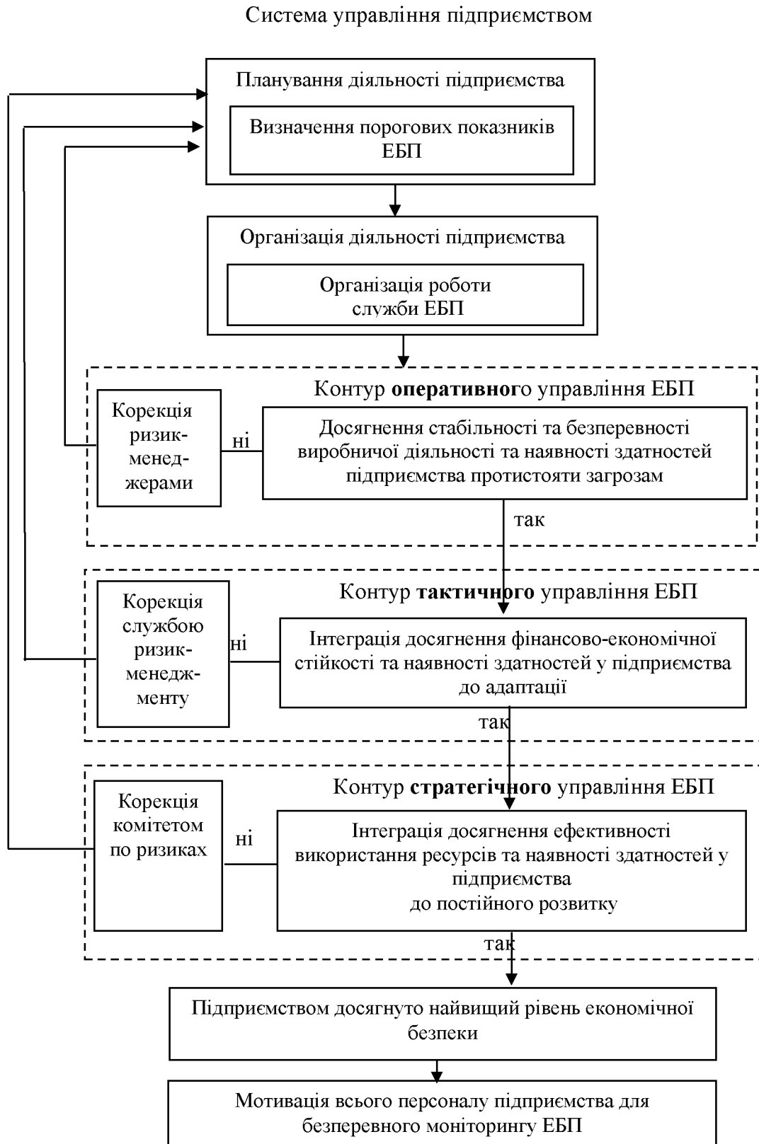
Рис. 1.3. Місце підсистеми управління економічною безпекою підприємства в системі його стратегічного управління

безпеці. Реактивні – це заходи, які приймаються при реальному виникненні загроз або необхідності мінімізації їх негативних наслідків.