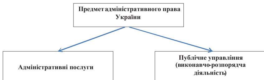
Мал. 1.1.1. Предмет адміністративного права

Отже, предметом адміністративного права України є суспільні відносини, які виникають між суб'єктами публічної адміністрації та приватними особами. За змістом предмет адміністративного права складається з надання адміністративних послуг і здійснення виконавчо-розпорядчої діяльності публічною адміністрацією.