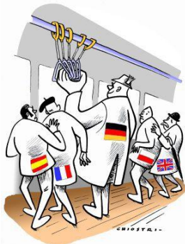
2. CHIOSTRI (LA STAMPA)