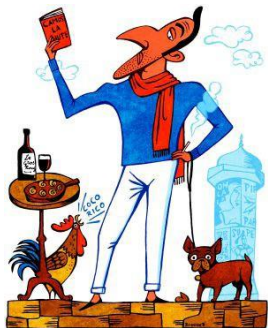
1. PAUL BOMMER (THE GUARDIAN)

3. Mira las viñetas que aparecen a continuación e identifica cada una de ellas con el país que representan.