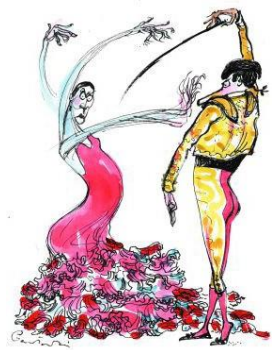
5. JACEK GAWLOWSKI (GACETA WYBORCZA)

Viñetas publicadas en varios artículos del periódico El País . Para leer los artículos a los que acompañan estas viñetas id a http://internacional.elpais.com/internacional/2012/01/25/actualidad/1327490972_788104.html (Consultado el 30 de mayo de 2015)