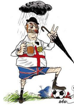
4. AUREL (LE MONDE)