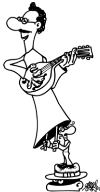
3. FORGES (EL PAÍS)