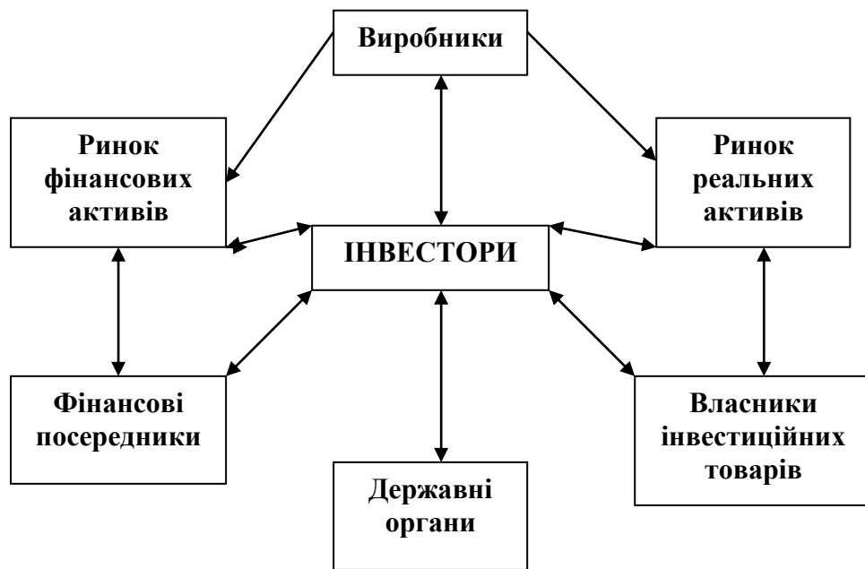
Рис. 1. Структура інвестиційного ринку

якому взаємодіють інвестори, виробники та власники інвестиційних товарів, фінансові посередники та органи державної влади та управління.